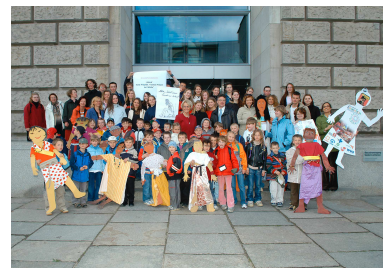
Cheerleader-Gruppe in der Ganztags Hauptschule Siedlingshausen

Bei den Wahlcafés 2005 haben die Jugendlichen ihre Möglichkeiten, Aufmerksamkeit zu bekommen, genutzt: