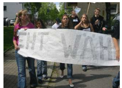
Demonstration „Geht wählen!“ der Gesamtschule Essen-Borbeck

Informationen zu den Wahlcafés zur Landtagswahl und zur Bundestagswahl 2005 http://www.friedensband.de/wahl/index.htm